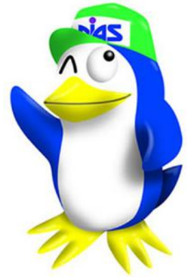
大学イメージキャラクター

長崎県は豊かな海に囲まれ島の数も日本で一番多い“海洋県”であり、また日本の近代造船業の発祥の地でもあります。その長崎の地で、長崎総合科学大学 海洋・スポーツ文化センターは日本で一番海に近いという大学の特色を生かし、海洋スポーツ・海洋文化の普及を図るための活動を支援しています。四方を海にかこまれている日本の「海と船」について一緒に楽しく学びましょう。