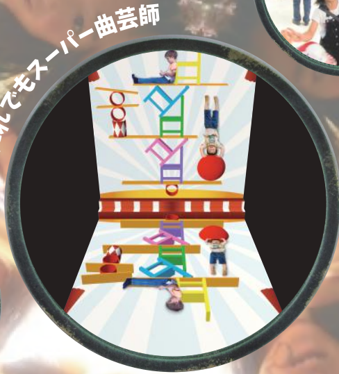
だれでもスーパー曲芸師