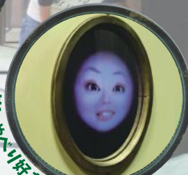
おじいちゃん好きな魔法の鏡