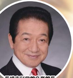
長崎市科学館名誉館長 草野 仁