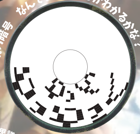
鏡の暗号 なんて書いてあるかわかるかな？