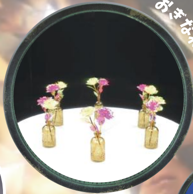
おまじないのテーブル