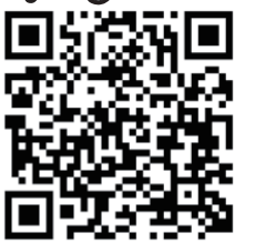
科学館ホームページ

主催 / 長崎市科学館 (指定管理者: 長崎ダイヤモンドスタッフ株式会社) 共催 / KTN テレビ長崎 後援 / 長崎新聞社、(株)長崎ケーブルメディア、ながさきプレス