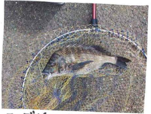
クロダイ(35cm)が全釣れました。