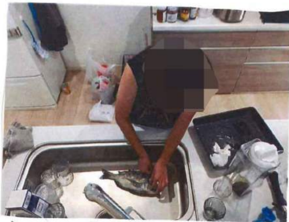
ウロコは尾びれから頭の方に向かってとります。