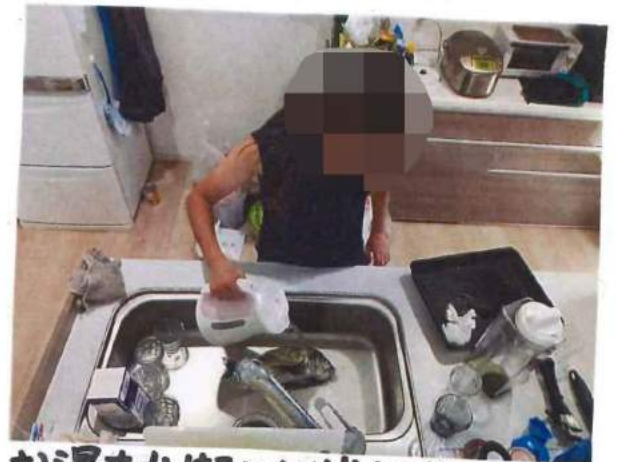
お湯をかけると、とれやすくなりました。