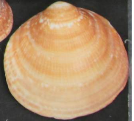
チヨウセンハマグリ